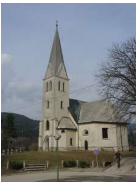
Cerkev sv. Barbare na griču

V davnih časih, ko je bilo okoli Barbarinega griča še ogromno jezero, je živel grof, ki je imel tri hčerke. Eni je bilo ime Barbara, drugi Rozalija, tretja pa je bila Marija. Nekega dne so se tri hčerke šle vozit s čolnom po jezeru, takrat pa je nastal strašen vihar. Njihov čoln se je prevrnil in vse tri so se utopile. Barbarino truplo so našli na mestu, kjer so zato zgradili Barbarino cerkev, Marijo so našli malo stran, tam so zgradili cerkev svete Marije, Rozalijo pa so našli malo pod Barbaro in ker dve cerkvi nista mogle stati tako blizu skupaj, so tam postavili grobnico.