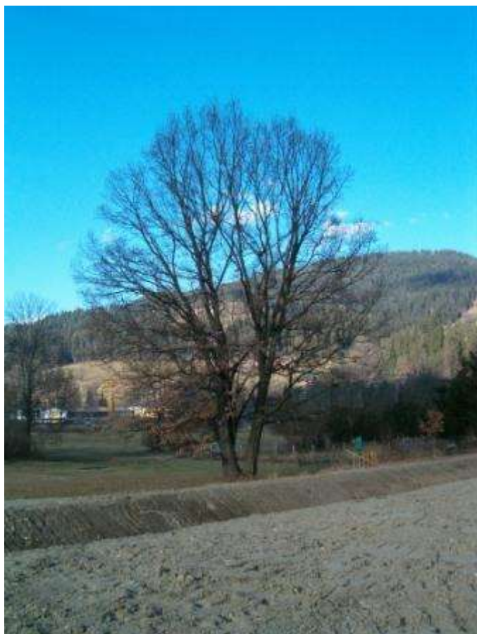
Hrast po katerem naj bi Dobja vas dobila ime in obrtna cona v ozadju

In tako sem se odpravila pregledovati bližnjo okolico, v upanju, da odkrijem kakšno zanimivost. Naletela sem na gospoda, ki je kot otrok poslušal zgodbe o Dobji vasi in pokazal mi je pot ob reki Meži, v obrtni coni Log, kjer stoji hrast po katerem je Dobja vas dobila ime. Tako vsaj pripovedujejo ljudje, živeči nasproti naselja samega. Zanimivo se mi je zdelo, da tega nihče v naselju ni vedel, ali pa mi vsaj niso omenili.