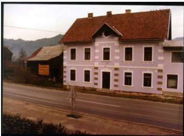
Nekdanja gostilna Likevič