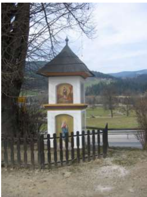
...in še enkrat zidano znamenje