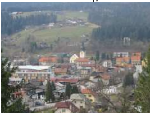
Cerkev sv. Marije na Jezeru-pogled z Barbarinega griča