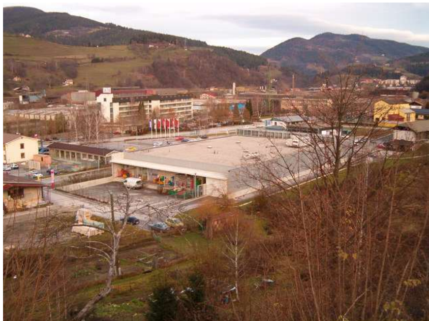
Področje, ki so ga včasih imenovali “pod kopšam”

Gozd nad doblim dvorom, kjer naj bi prvotno stal grad Dob, je označen z ledinskim imenom Pod Kopscham. Po pripovedovanju ljudi doma s kemptije na Navrškem vrhu (nad Dobjo vasjo), so pri njih in pri sosednji kmetiji nekdanj požeto rž naložili v kupe, visoke okoli šest metrov. Imenovali so jih “kopše”, področje, ki se nahaja pod temi kopšami pa so označili “pod Kopscham” oziroma “pod kopšam”.