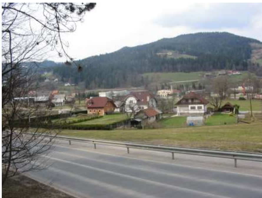
Log z industrijsko cono v ozadju