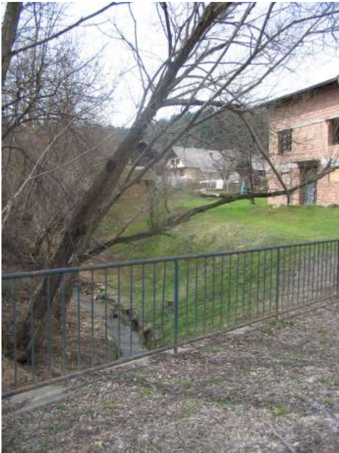
Pod mostom naj bi včasih stala kovačija...

Verjetno so tudi ti oboki vzrok za legendo, ki govori o zlatem 'zotlno'(sedlo), ki da je tam nekje pri mostu zakopan. To so najboljše vedeli furmani, ki so tam vozili rekoč, da je cesta vedno 'votlo' pela. Mnenja o tem, da je bila pri tem mostu leta 1982 podrti Močnikova hiša nekdam tudi mitnica, pa so deljena. Po legi sodeč (most) bi mogoče lahko bila.