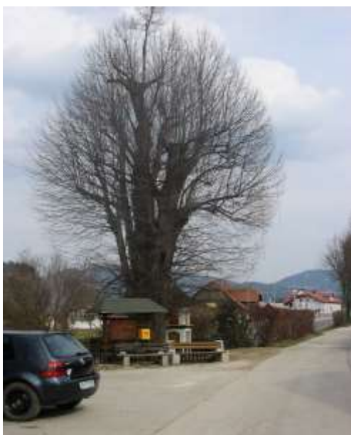
Kapelica in lipa v središču naselja...

.Kapelica, ki je pod lipo v naselju Dobja vas, je bila skoraj zagotovo v lasti Žibovtovih. Slednji so 'vedno tudi obžagovali' lipo. Kdo točno in ob katerem dogodku jo je postavil, pa ne ve nihče. Kapelica je bila pred uničenjem prvič rešena leta 1972, lepo obnovljena pa je bila ponovno v letu 2001.