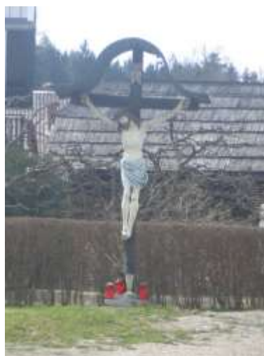
Kalvarija križa na križišču