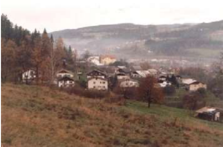
Dobji dvor - danes naselje individualnih hiš in stanovanjskega bloka na mestu, kjer je prej bil dvorec.

Pojavlja pa se še druga zgodba v zvezi z zakladom, namreč da so tega grofa večkrat prišli prosjačiti berači za denar in hrano, pa nikomur ni nič dal. Tako ga je nekega dne eden od beračev preklel in kmalu je ta grof v revščini umrl. Od takrat naprej se nad dvorom vedno dela mavrica, in če najdeš njen konec moraš kopati in tam bo grofov skriti denar.