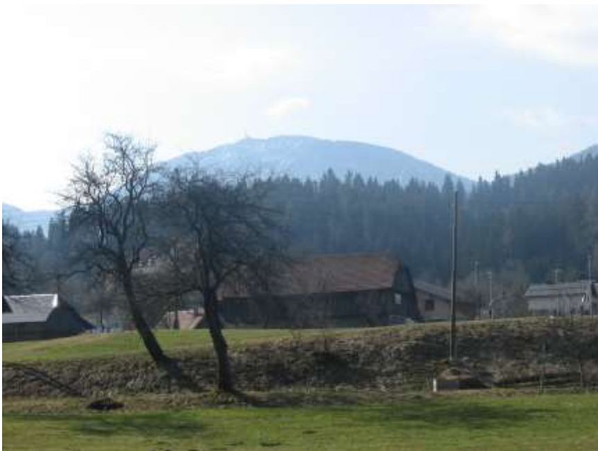
Presahli del bivše struge Meže, kjer naj bi bil izvir tople vode, kmetija Tomaž v ozadju

Sem pa izvedela še drugo zgodbo in sicer, da je bil tu izvir po domače imenovane "kisle vode", torej mineralne vode, ki je imela veliko zdravilnih lastnosti in so jo hodili sem pit tudi ljudje iz drugih krajev. Tudi ta izvir naj bi po regulaciji reke Meže presahnil, kje točno je bil pa nihče več ne ve.