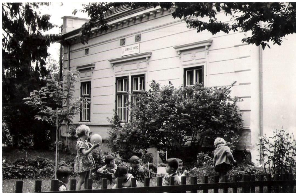
Slika 15: Fotografija lendavskega otroškega vrtca na Glavni ulici 60. leta prejšnjega stoletja.

Cicibančki so bili vsako leto aktivni pri različnih nastopih in so vestno sodelovali tudi pri maškaradi, ki si jo je ogledalo mnogo ljudi, leta 1957 baje celo preko 2. 000 ( Pomurski vestnik , 19. 6. 1958: 4). Maškare vrtca in osnovne šole so se vsako leto sprehodile v povorki skozi mesto, kar je postala že tradicija. Ob deseti obletnici lendavskega vrtca so se v okviru občinskega praznika pripravili tudi na nastop. V vrtcu so pripravili tudi razstavo ob tem jubileju (ibid.). Za zaključek dela v šolskem letu 1958 so vse otroke pogostili (ibid.).