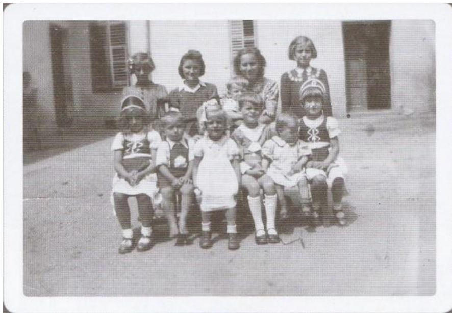
Slika 13: Na fotografiji je skupina otrok in madžarski vzgojiteljici iz dobrovniškega vrtca leta 1943.

Otroški vrtec v Dobrovniku je v času madžarske oblasti ponovno zaživel oziroma bil odprt leta 1942 (Attila Kovács 2011: 69). Na fotografiji, ki je nastala med neko proslavo, so slikani otroci, med njimi sta dve deklici oblečeni v obleke madžarskih narodnih barv. Med otroki sta tudi dve vzgojiteljici iz Madžarske (Kovács 2011: 203).