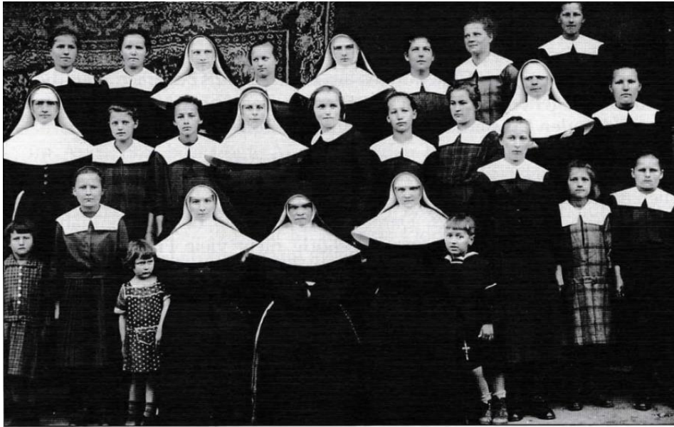
Schwestern, Kandidatinnen und Kinder in Dolnja Lendava um 1930

Slika 6: Na fotografiji so sestre in kandidatke v Dolnji Lendavi, med njimi pa so tudi otroci.