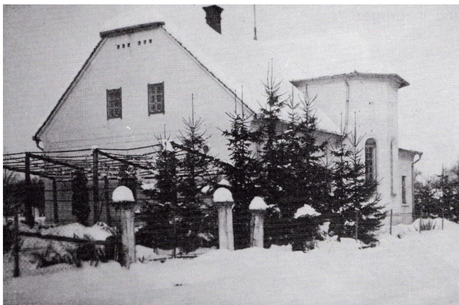
Slika 7: Na fotografiji je hiša samostana šolskih sester v Žižkih.