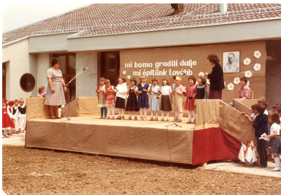
Slika 16: Na fotografiji je lendavski naftin otroški vrtec iz leta 1981. Otroci nastopajo na proslavi, ki je dvojezična.

»Sama uvedba delne dvojezičnosti v šolah ni potekala ločeno od ostalih družbenih procesov, temveč je bila del širše akcije, v kateri so bile tudi pred uradnike v javnih službah postavljene nove zahteve. Na območjih, kjer živita avtohtoni manjšini v Sloveniji, so začeli postavljati dvojezične table, okrepili so oddaje v jezikih manjšin na radiu, načrtovali združevanje slovenskih in manjšinskih kulturnih društev v enotno društvo, ki bi lahko nastopalo v dveh jezikih. Največja težava je ostajala nezadostno število usposobljenih za dvojezične vrtce in šole, saj je bilo prosvetnih delavcev s tekočim znanjem dveh jezikov malo. To je bil tudi glavni vzrok, da dvojezičnost že z začetkom šolskega leta 1959/60 ni imela širših razsežnosti, temveč je bila načrtovana na daljši rok postopno od vrtca preko osnovnih na nadaljnje stopnje šolanja.« (Gabrič 2006: 167)