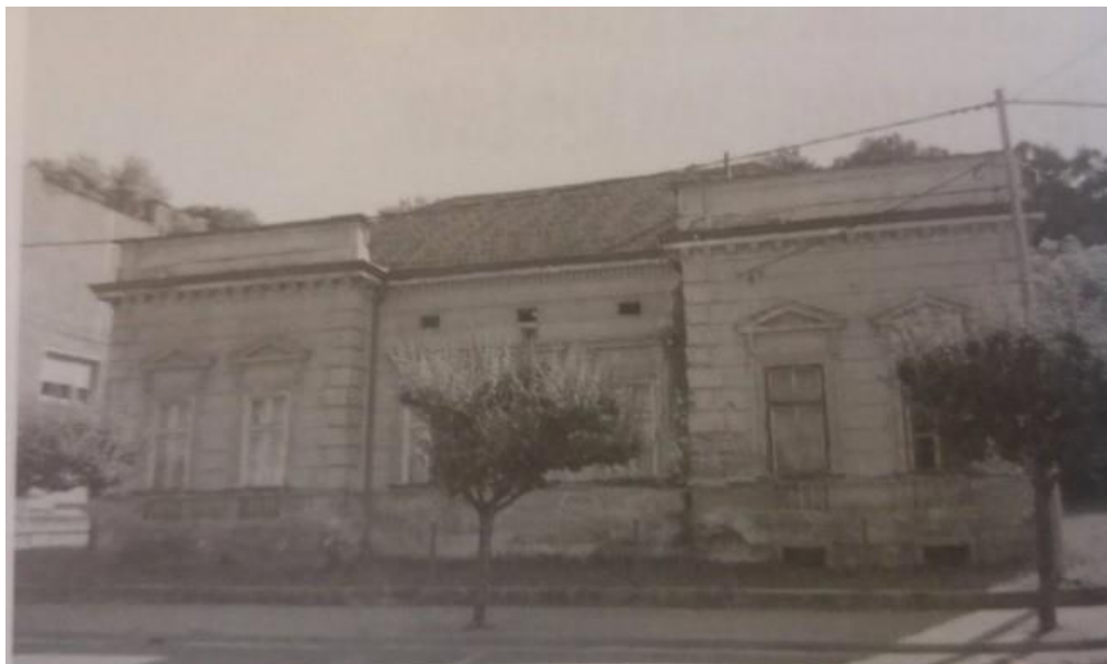
Slika 5: Zgradba, v kateri je bil prvi otroški vrtec v Dolnji Lendavi; vodile so ga šolske sestre.

Nadalje časopisje problematizira, da je otroški vrtec bil v »ogrskih časih« ne le za madžarizacijo, temveč tudi za vzgojo otrok in mladine, kar bi pokazala vodena statistika o številu »ponesrečene dece« (Morszka krajina, 3. 10. 1926: 1). Prej, ko je obstajal ogrski vrtec in zdaj, ko te ustanove ni. Z ustanovitvijo otroškega vrta bi država naredila veliko dobrega za prebivalstvo, še posebej za matere, ki delajo za samo preživetje in so preobremenjene, vrtec bi jih razbremenil in otroke dobro vzgojil (Morszka krajina, 3. 10. 1926: 1).