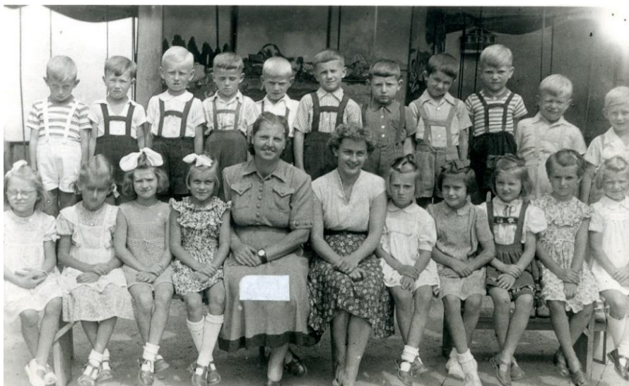
Slika 14: Na fotografiji je lendavski otroški vrtec iz leta 1949.