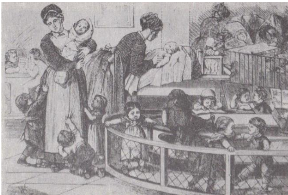
Slika 1: Risba prikazuje otroški vrtec okoli leta 1890.

Sama določila o otroških vrtcih so predpisovala tudi samim ustanoviteljem zahtevane pogoje, tako glede zdravega, primerno osvetljenega prostora, vključenega vrta in igrišča, opreme, kot so klopi in mize, vzgojne naprave in usposobljenost učnega osebja (Pavlič 1991: 47). Ureditev in delo otroških vrtcev so preverjali šolski nadzorniki po posebnih ministrskih navodilih, ponekod pa so otroške vrtce in zavetišča lahko nadzirali tudi krajevni ženski odbori (Pavlič 1991: 47–48). Le-ti so kdaj pa kdaj ob obisku svetovali o izboljšanju razmer ipd. Zapisano je bilo tudi, da šolski nadzorniki pazijo zlasti na pravo vzgojno vrednost iger, na vsestransko zaposlitev otrok, na dosledno upoštevanje pedagoškega načela aktivnosti v vsem izobraževanju in ne le v ročnih spretnostih, naj preprečijo poučevanje računanja, branja in pisanja ter strogo šolsko disciplino, naj zahtevajo za otroke čim več gibanja na prostem, in drugo (Dolanc 1970: 667). Pomen ustanavljanja otroških vrtcev so objavljali tudi v časopisju, tako je Učiteljski tovariš opozoril, da je za vstop v šolo potrebno dopolniti domačo vzgojo in jih tako telesno kot duševno pripraviti na šolo (Pavlič 1991: 48).