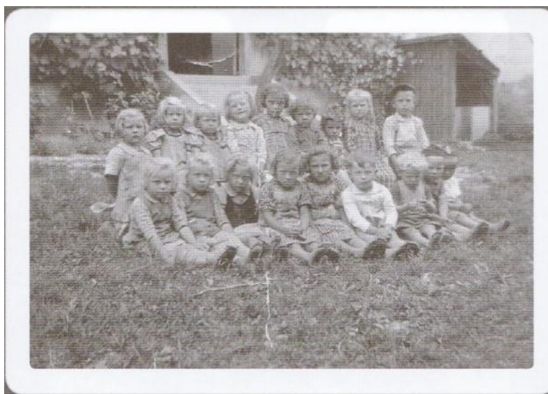
Slika 10: Na fotografiji so otroci iz dobrovniškega vrtca leta 1940.

O samem delovanju vrtca sem našla zelo malo. Po podatkih zgodovinarja Atille Kovácsa sta v otroškem vrtcu delovali dve sestri iz Slovenske Bistrice (2011: 203). Na priloženi fotografiji so otroci iz dobrovniškega vrtca, o katerih Attila Kovács pravi, da nobeden od njih ni bil iz uradniške družine, so pa bili po rodu vsi otroci iz Dobrovnika (ibid.).