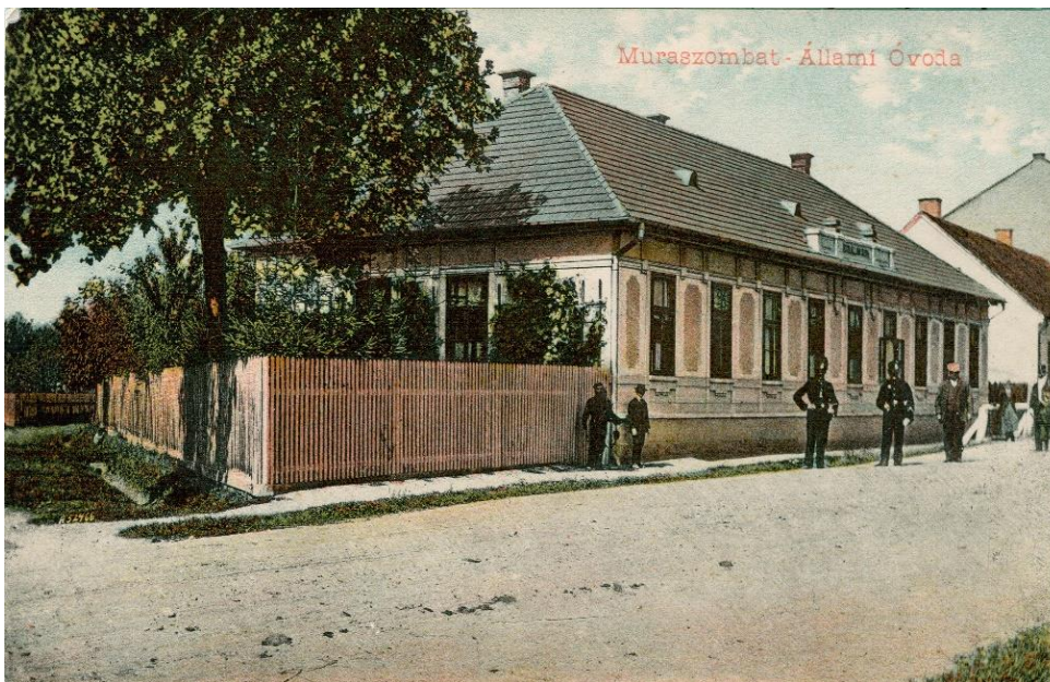
Slika 11: Na razglednici je stavba državnega vrtca v Murski Soboti.

Murska Sobota je imela »óvodo« že v času Avstro-Ogrske, namenjen pa je bil madžarizaciji otrok. Nato je prišla prva svetovna vojna in stavbo so namenili za uporabo vojski. To, da so v zgradbah, kjer so delovali vrtci, bile v času vojne stavbe, uporabljene za vojaške namene, ali so imeli v njih vojaška poveljstva, je bilo prisotno tudi drugod. V Murski Soboti je bila v stavbi med prvo svetovno vojno kasarna.