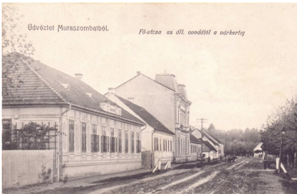
Slika 2: Razglednica prikazuje glavno ulico v Murski Soboti, na levi strani vidimo stavbo otroškega vrtca oz. »ovode« iz časa Avstro-Ogrske.

Kot sem že omenila, je v Železni županiji leta 1883 prišlo do ustanovitve društva šolskih vrtnaric, ki ga je oblast podprla z letnim zneskom 750 forintov (Kuzmič 2015: 40). Še istega leta je bil ustanovljen otroški vrtec v Murski Soboti, ki je svoje prostore imel v hiši na Glavni ulici 13 (Fujs 2015: 26). Imenoval se je po madžarsko Állami Óvoda oz. državni vrtec. V vrtcu je delovala ena vzgojiteljica (ibid.).