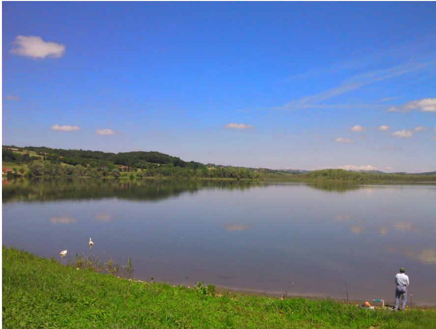
Fotografija št. 2: Ribič ob Ledavskem jezeru.