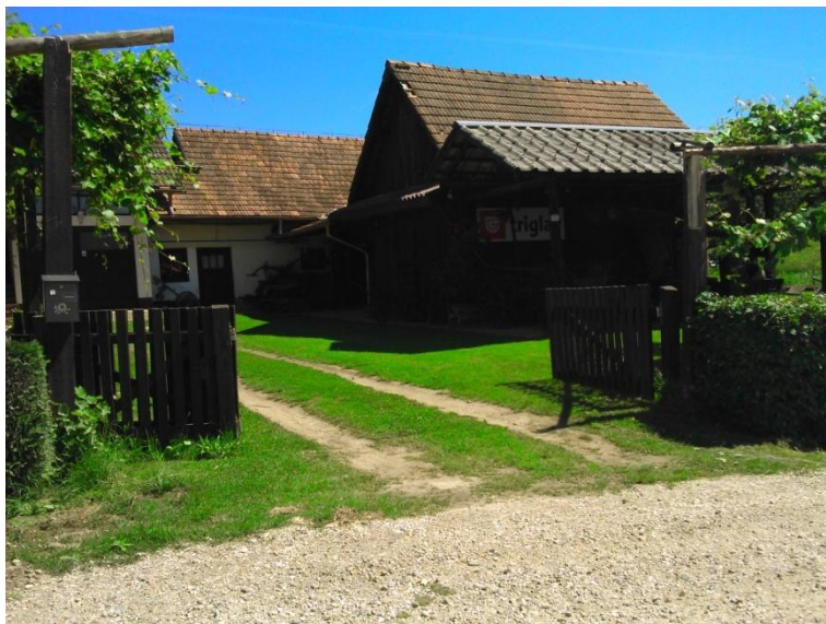
Fotografija št.8: Bransbergerjeva domačija .

V dobro ohranjeni domačiji Bransbergerjevih je od leta 1997 urejen etnološki muzej, kjer so razstavljeni gospodinjska in kmečka orodja iz začetka 20. stoletja, ki nam prikazujejo življenje in delo naših babic in dedov in so jih iz svojih domačij prinesli sovaščani. V posebnem prostoru je bila že leto prej urejena galerija s stalno razstavo likovnih del lastnika