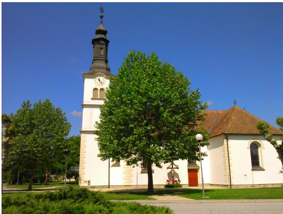
Fotografija št. 9: Cerkev sv. Jožefa na Cankovi.