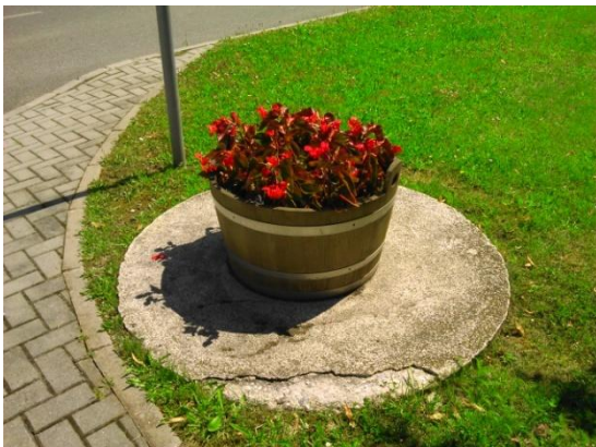
Fotografija št. 1: Nekoč vodnjak, danes vedro z rožami (, 4. 6. 2014)

Kraj Cankova je prvič omenjen leta 1212. Slovensko ime kraja označuje mrzel izvir, ki mu Avstrijci rečejo Kaltenbrun in madžarsko Hydegkuth. Obstaja pa tudi legenda, da je Cankova poimenovana po vodnjaku v vasi, kjer je »cankala« (kapljala) voda. Danes je okrasni vodnjak postavljen sredi parka v središču vasi, na mestu, kjer pa je nekoč stal vodnjak, pa danes stoji vedro z rožami.