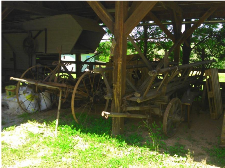
Fotografija št. 7: Stari kmetijski stroji in naprave.

Na dvorišču kmetije so na ogled razstavljeni starodavni stroji in orodja, ki so se uporabljali pri raznih kmečkih opravilih. Še posebej so ponosni na čez 80 let staro samohodno lokomobilo in mlatilnico, ki se uporabljata pri spravilu žita. Poleti lahko na kmetiji obiščete etnološko prireditev Žetev in mlatitev po starem. Na kmetiji imajo 30 ležišč in igrišče za tenis (internetni dostop http://www.cankova.si (18. 4. 2014)).